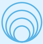
FLUX DE ENERGIE ÎMBUNĂTĂȚIT