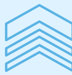
ÎMBUNĂTĂȚEȘTE PERFORMANȚELE SPORTIVE