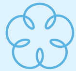
SUSȚINE STAREA GENERALĂ DE SĂNĂTATE ȘI DE BINE